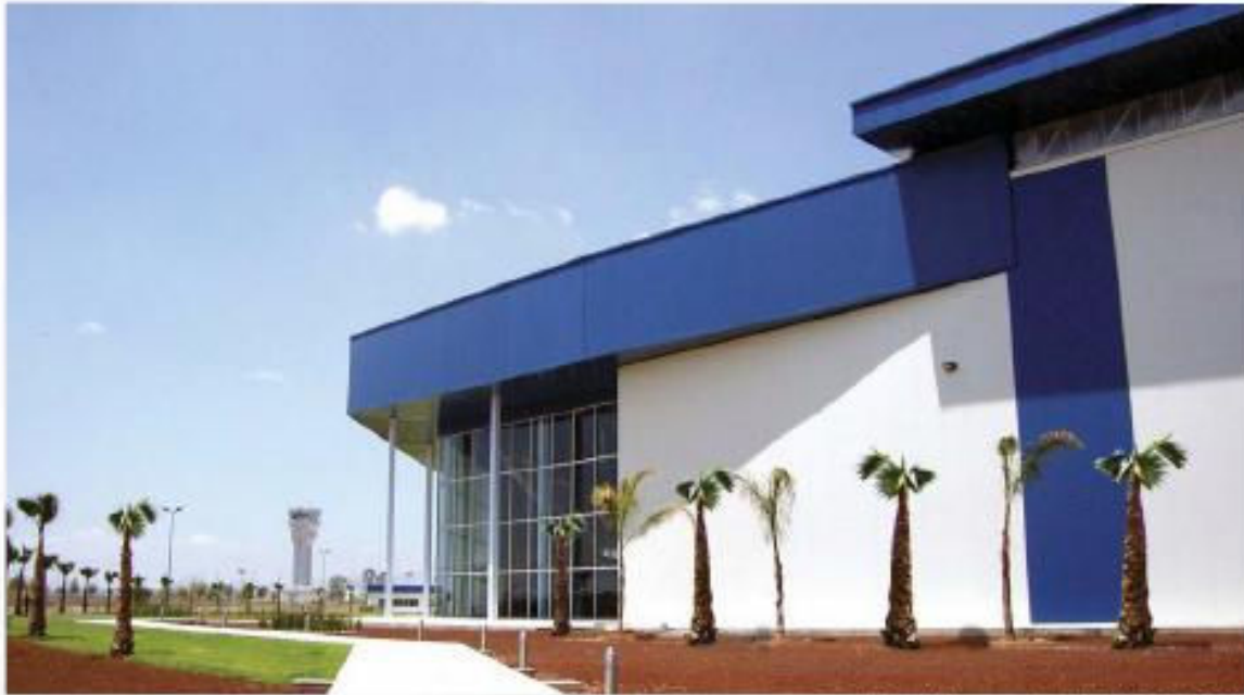
Cumple con la norma: NOM-008-ZOO-1994